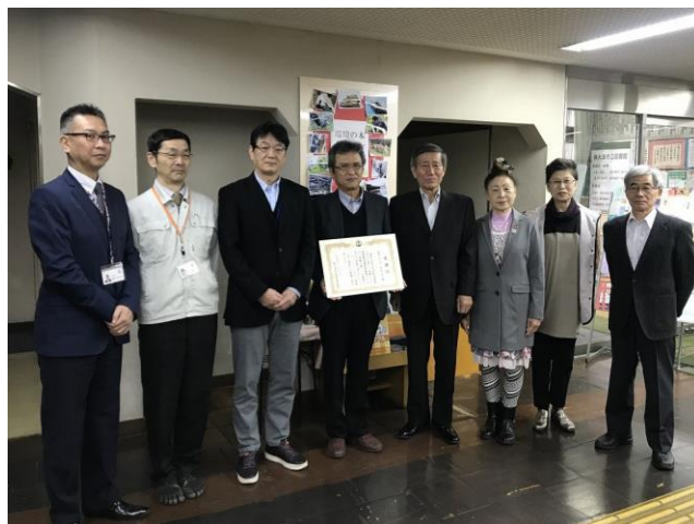
関係者による記念写真

一人でも多くの市民の方が、これらの本を手にとってご活用いただき、環境そして再生可能エネルギーに、さらにご関心を持っていただければと思います。