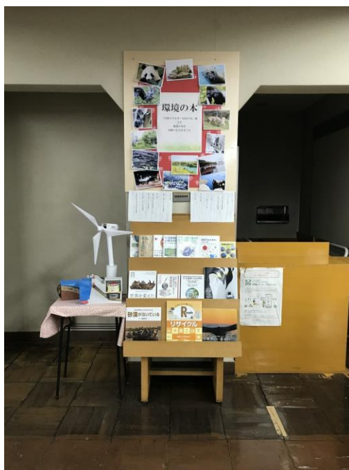
図書館に設置された「環境の本」コーナー

この度、約 5 年が経過し基金の活用を検討した結果、泉大津市に環境に関する書籍を寄贈しました。11 月 28 日から 12 月末まで、市図書館に入って右側に「環境の本」コーナー（自然エネルギー市民の会寄贈）を設置いただいています。